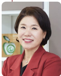
조 은 희 서초구청장 <56기>

최고위정책과정에서만 느낄 수 있는 끈끈한 분위기가 있습니다. 과정을 마친 후에도 원우들과 지속적인 교류를 원하시는 분들께 추천합니다. 또한 풍부한 경험과 지식을 겸비하신 강사님들과의 질의문답 시간도 기억에 남습니다. 급변하는 행정환경과 글로벌 시대의 공공정책의 방향성에 대해서도 고민해 볼 수 있는 과정이라 생각합니다.